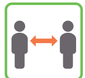
身体的距離の確保